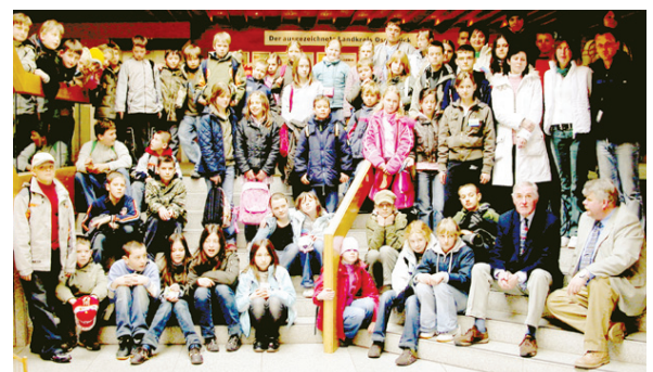
Auch die Patenschaft von Bersenbrück mit dem Heimatkreis Greifenhagen mündete in eine Partnerschaft mit der polnischen Stadt (poln. Name: Gryfino) – hier der Schüleraustausch.